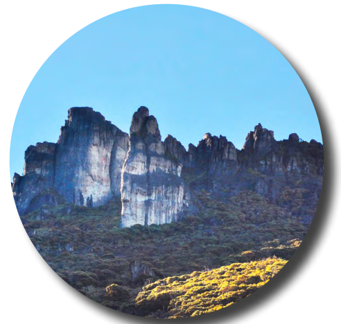
FOTO 20. Crestones del Parque Nacional Chirripó.

Los Crestones del Parque Nacional Chirripó: son un símbolo nacional reconocidos por su valor paisajístico y riqueza natural. Representan la riqueza geológica y natural del país. Destaca la importancia de la conservación de la biodiversidad y los esfuerzos del país en este ámbito. Es el primer atractivo turístico del país en recibir este reconocimiento. Contribuye a la economía local y nacional al atraer turistas. Se encuentra en la Reserva de la Biosfera de La Amistad-Pacífico como un área protegida. Además, son Patrimonio de la Humanidad declarado por la UNESCO. Declarado símbolo nacional en 2011.