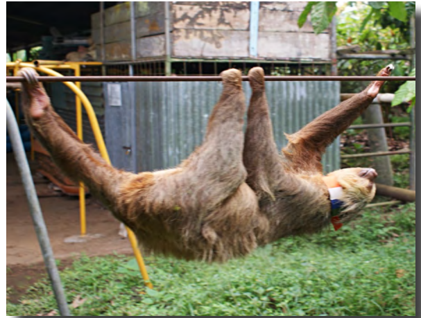
FOTO 19. Perezoso de dos y tres dedos

Tomado de: https://www.revistas.una.ac.cr/index.php/ambientales/article/view/17611/26313 (perezoso de dos dedos) https://paginas.cimpa.ucr.ac.cr/simmac/index.php/en/inicio/acerca-de/galeria/costa-rica (perezoso de tres dedos).