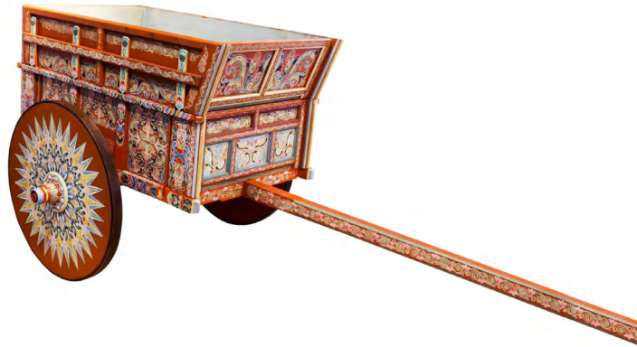
FOTO 5. Carreta Típica.

Carreta típica: es un símbolo nacional del trabajo. Representa la cultura de la paz y el trabajo simbolizando humildad, paciencia, sacrificio y constancia. Reconocida por la UNESCO como Obra Maestra del Patrimonio Oral e Inmaterial de la Humanidad. Fue declarada símbolo nacional en 1988.