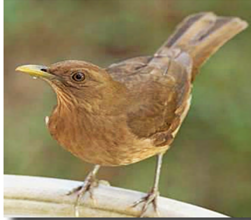
FOTO 17. El yigüirro.

El Yigüirro: fue declarado Ave Nacional por su importancia en la cultura costarricense y su relación con su canto que anuncia el inicio de la temporada de lluvias. Representa la conexión del pueblo costarricense con la naturaleza y la biodiversidad del país, destacando la riqueza de su fauna. Declarado símbolo nacional en 1977.