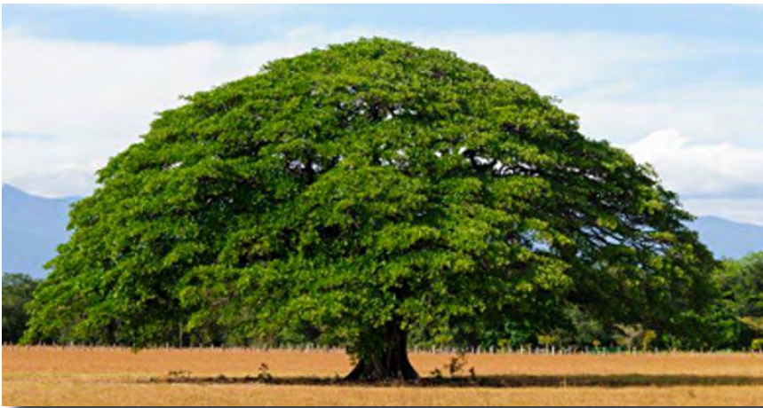
FOTO 16. Árbol de Guanacaste. Tomado de: https://www.asamblea.go.cr/sd/Documentos%20compartidos/S%C3%ADmbolos%20Nacionales.pdf

El Guanacaste: el Árbol de Guanacaste es un símbolo natural de importancia ecológica cultural que representa la protección, la abundancia y la unión debido a que su copa amplia brinda sombra y refugio a personas y animales. Es un árbol típico de las zonas secas del país. Resalta el compromiso de Costa Rica con la conservación de su riqueza natural. Declarado símbolo nacional en 1959.