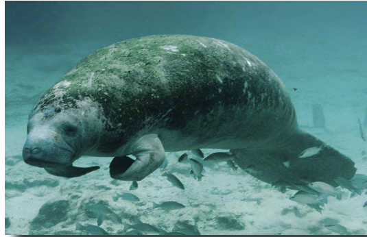
FOTO 13. Manatí del Caribe.

Manatí del Caribe: es un símbolo nacional de tipo natural de la fauna marina debido a su importancia ecológica y su vulnerabilidad como especie en peligro de extinción. Es un mamífero acuático que habita en los ríos y costas del Caribe costarricense y representa el compromiso del país con la conservación de la biodiversidad y la protección de los ecosistemas marinos. Declarado símbolo nacional en 2014.