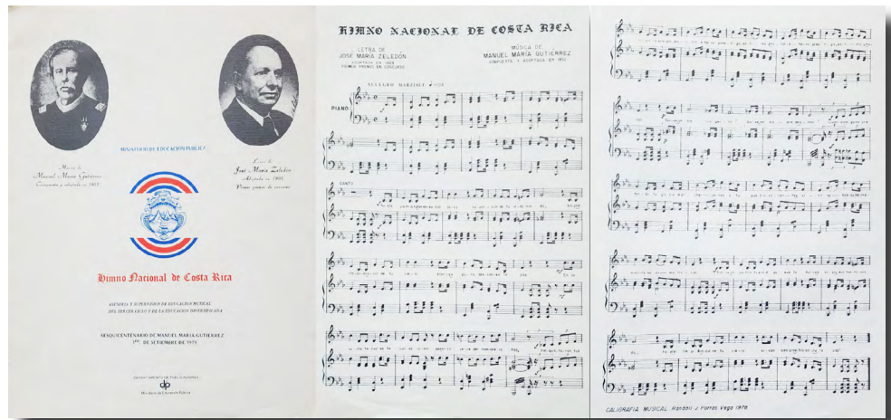
FOTO 3. Himno Nacional de Costa Rica.

Himno Nacional de Costa Rica: símbolo patrio de identidad y soberanía. Representa el orgullo, la historia y valores del país en el que se destaca la paz, el trabajo y la libertad del pueblo costarricense. Declarado símbolo nacional en 1949.