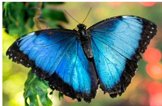
FOTO 14. Mariposa Morpho Azul.

Mariposa Morpho Azul: es un símbolo nacional de tipo natural. Debido a su deslumbrante color azul metálico representa la riqueza biológica del país. Es una de las especies más emblemáticas de Costa Rica y se encuentra principalmente en bosque húmedo del Caribe. Su designación como símbolo nacional refuerza el compromiso del país con la conservación de la biodiversidad. Fue declarada símbolo nacional en 2017.