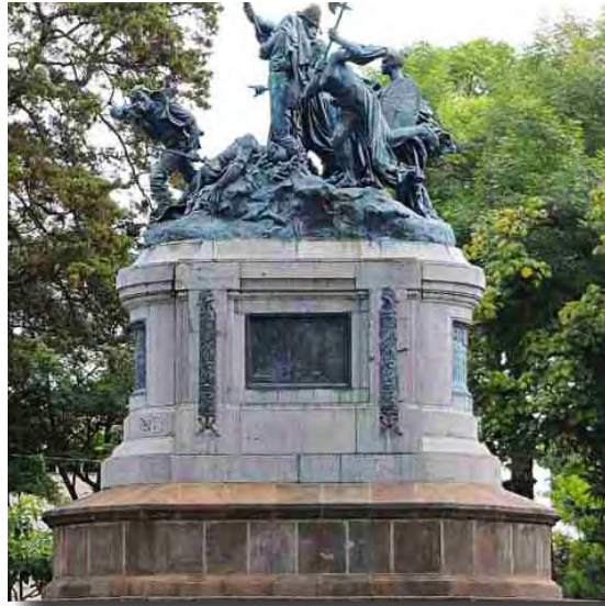
FOTO 22. Monumento Nacional.

Monumento Nacional: No es declarado símbolo nacional, sin embargo, lo colocamos en esta lista ya que es muy representativo de la historia de Costa Rica. Está ubicado en el Parque Nacional en San José. Es un símbolo patrio de tipo histórico. Este monumento fue creado para conmemorar la Campaña Nacional de 1856-1857 en la que varios héroes lucharon contra los filibusteros comandados por William Walker. Representa la defensa de la soberanía y la libertad de Costa Rica y de Centroamérica. Fue develado el 15 de septiembre de 1895.