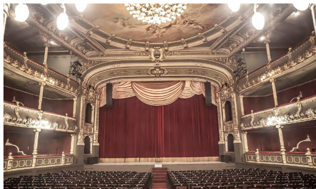
FOTO 12. Teatro Nacional de Costa Rica.

Tomados de: https://www.tec.ac.cr/hoyeneltec/2023/10/27/tec-teatro-nacional-estan-desarrollando-tecnologia-monitoreara-cambios-estructurales (fachada). https://si.cultura.cr/infraestructura/teatro-nacional-de-costa-rica (escenario).