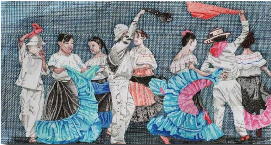
FOTO 6. Punto Guanacasteco.

Punto Guanacasteco: es un símbolo cultural de danza tradicional y de música nacional. Es un baile tradicional típico de Guanacaste y se caracteriza por su música alegre y ritmo contagioso que se ha determinado como folclor costarricense. Es un aporte a la riqueza cultural dancística y musical de Costa Rica. Declarado símbolo nacional en 2000.