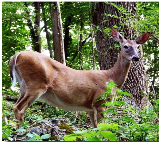
FOTO 18. Venado Cola Blanca.

Venado Cola Blanca: resalta la importancia de la conservación de la vida silvestre en el país. Este venado habita en diversas zonas de Costa Rica, especialmente en bosques y áreas protegidas. Se designa como símbolo nacional para generar conciencia sobre la necesidad de protegerlo de la caza y la destrucción de su hábitat. Declarado símbolo nacional en 1995.