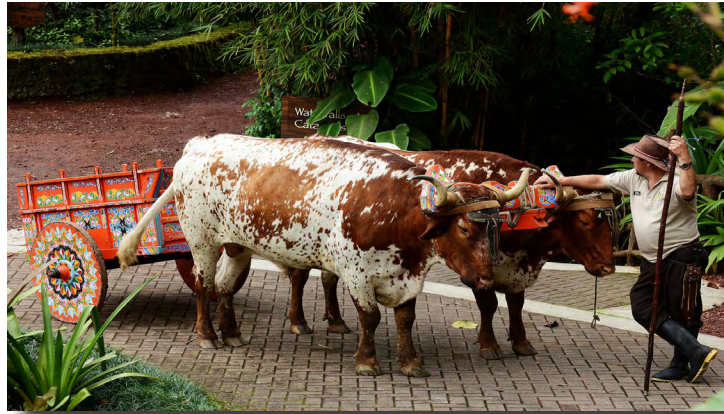
FOTO 9. Carreta con bueyes.

Carreta con bueyes: símbolo nacional que representa la cultura del trabajo, la paz y la tradición del país. La carreta típica costarricense se distingue por sus decoraciones artesanales muy propias y originales, las cuales se convirtieron en decoración indispensable en este medio de transporte. Sus diseños incluyen figuras geométricas, curvas con colores muy brillantes y cálidos. Se pintan a mano alzada. Fue declarada símbolo nacional en 1988.