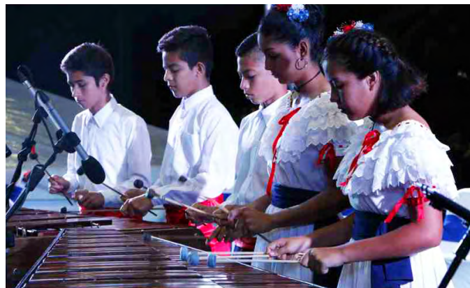
FOTO 8. Marimba costarricense.

La marimba: es un símbolo nacional de la cultura, la música y tradición del país. Es considerada como parte del patrimonio cultural inmaterial reconocido por la UNESCO. Forma parte de la música de festividades populares y fiestas privadas. En Costa Rica se celebra el día de la marimba el 30 de noviembre. Fue declarada instrumento musical nacional en 1996.