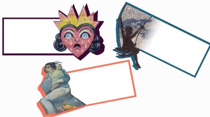
Imagen 2. Ejemplo de tarjetas