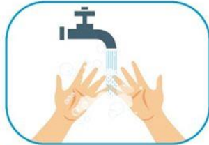
1 Lavado de manos