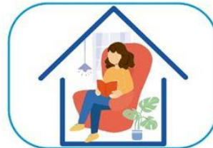
6 Quedate en casa