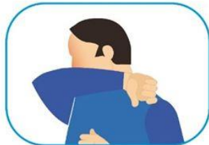
4 Protocolo de estornudo y tos