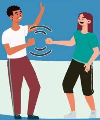
CON EL PUÑO DE LEJOS