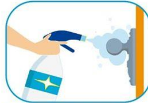
3 Limpiar las superficies de alto contacto