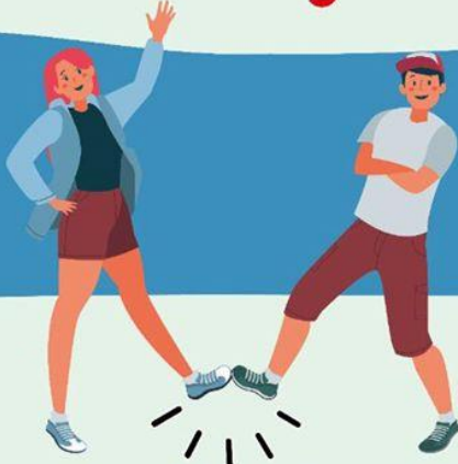
CON EL PIE