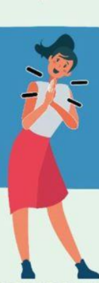
JUNTANDO LAS MANOS