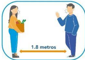
5 Distanciamiento social