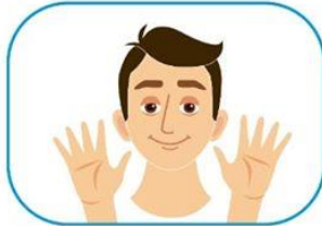
2 No se toque la cara si no se ha lavado las manos