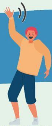
AGITANDO LAS MANOS