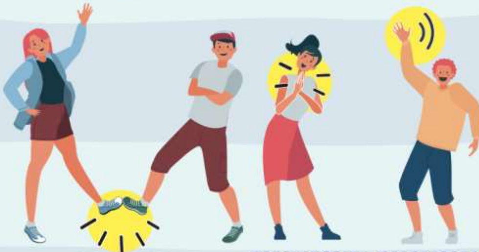
CON EL PIE