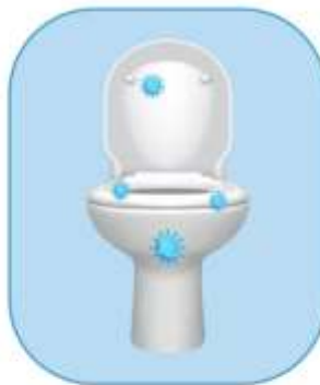
EL INODORO, SUPERFICIES DEL BAÑO, LAVAMANOS, GRIFOS