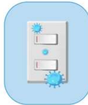
APAGADORES DE LUZ