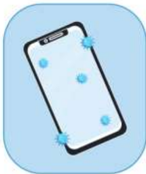
TELÉFONO CELULAR CONTROL REMOTO TABLETAS, TECLADOS

Desinfecte diariamente las superficies que se tocan con frecuencia