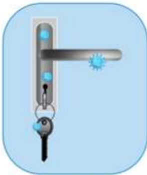
PERILLAS DE PUERTAS, PICAPORTES, LLAVES