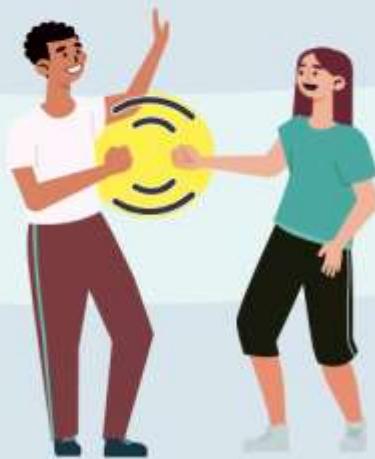
CON EL PUÑO DE LEJOS