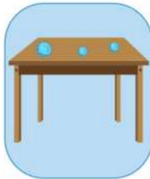
MUEBLES DE MADERA O PLÁSTICO