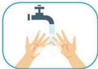
1 Lavado de manos