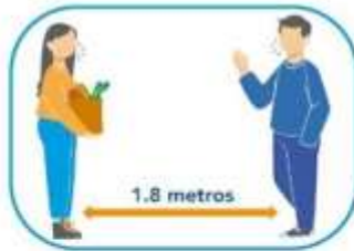
5 Distanciamiento social