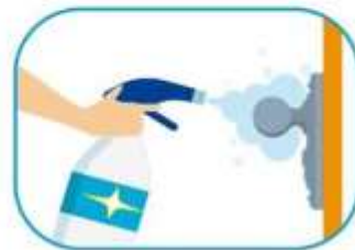
3 Limpiar las superficies de alto contacto