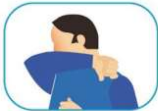
4 Protocolo de estornudo y tos