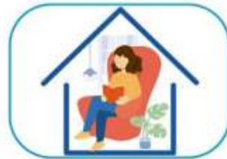
6 Quedate en casa