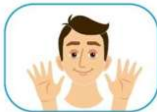
2 No se toque la cara si no se ha lavado las manos