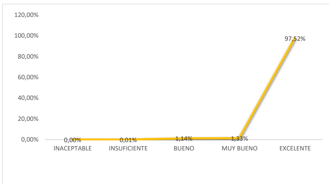
Gráfico N° 1, Fuente: Elaboración propia con datos del PIAD, Costa Rica; 2019

Resultado de la Evaluación del Desempeño 2017, Título Segundo, Distribución Porcentual según la Categoría.