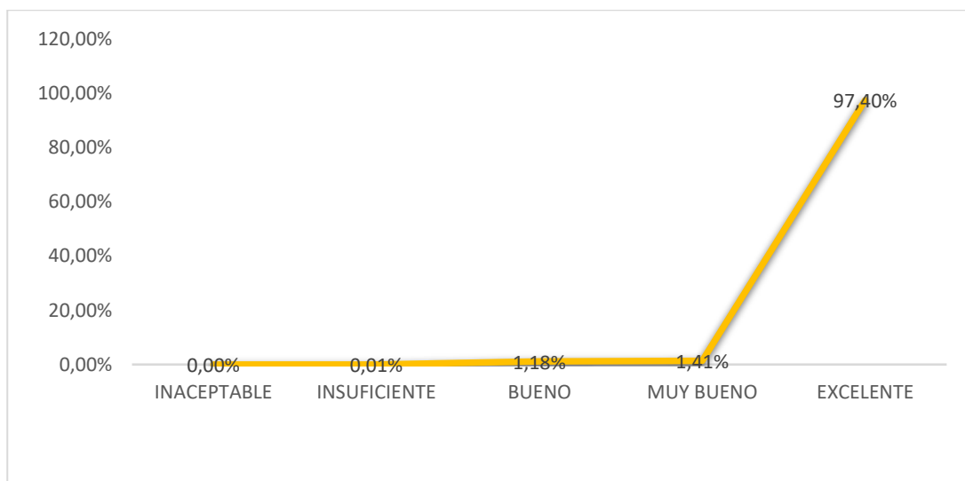
Gráfico N° 2

Resultado de la Evaluación del Desempeño 2018, Título Segundo, Distribución Porcentual según el Estrato Docente.